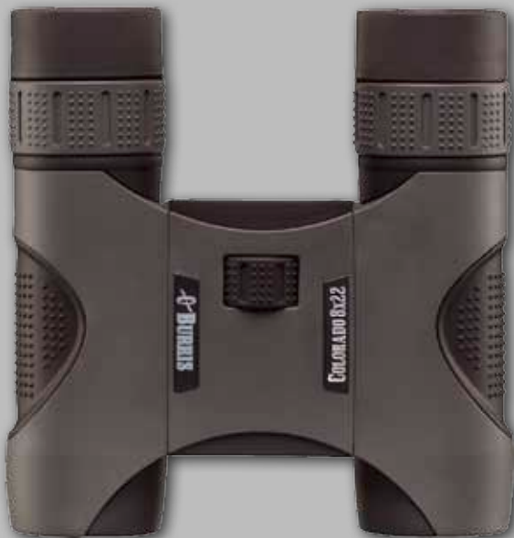
COLORADO 8 x 22